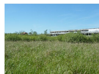
Foto 5: aufgelassenes Frischgrünland mit Weiden- gebüsch östlich des Hallenkomplex