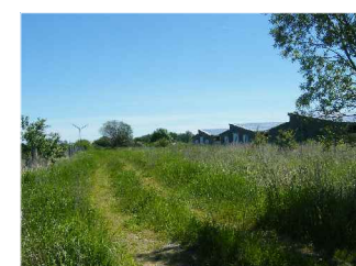
Foto 6: aufgelassenes Frischgrünland mit Fahrspur zum angrenzenden Graben

PROJEKTNAME Stadt Ribnitz-Damgarten I. Ergänzung der I. Änderung des Bebauungsplans Nr. 28 "Gewerbegebiet Tannenbergr"