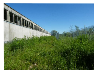
Foto 4: Ruderalfläche zwischen Hallenkomplex und östliche Zaungrenze